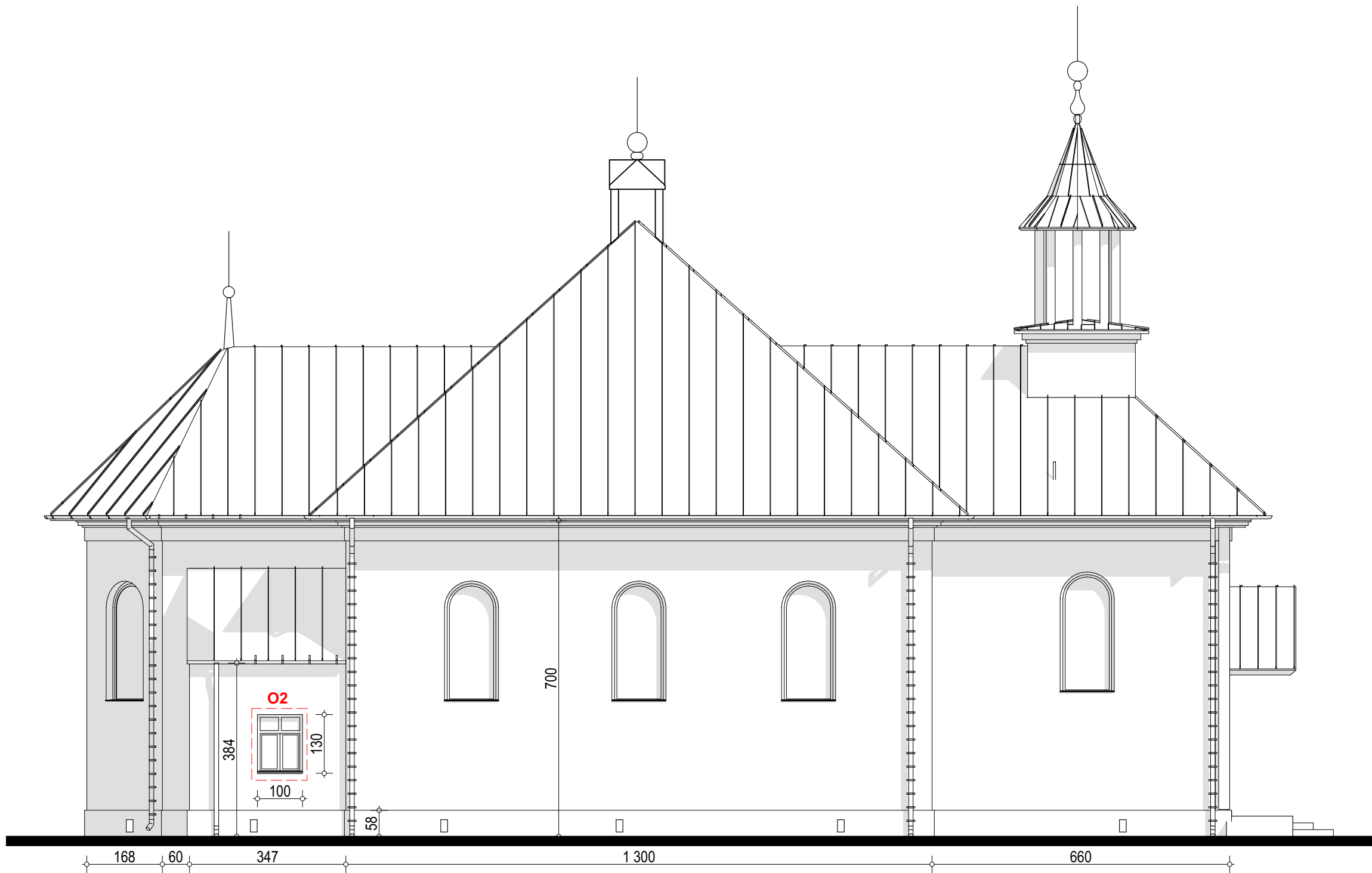
Rysunek ma charakter poglądowy