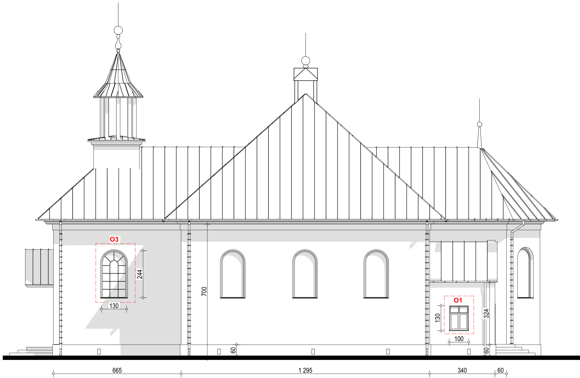
Rysunek ma charakter poglądowy